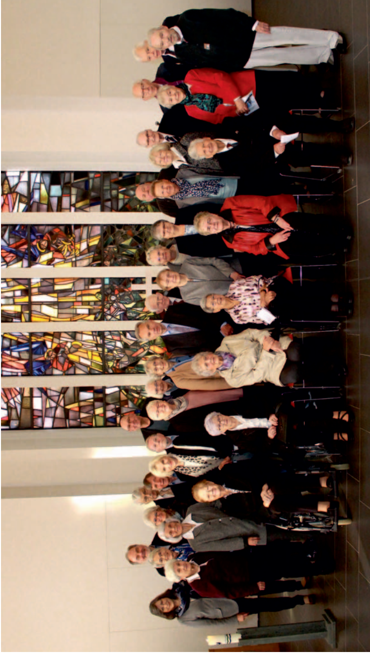
Die Jubelkonfirmandinnen- und konfirmanden versammelten sich nach dem feierlichen Gottesdienst zum Gruppenfoto.