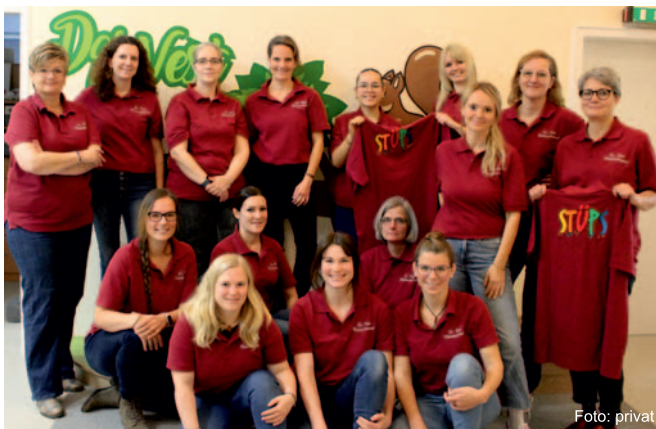
Die Mitarbeiterinnen in ihrer neuen „Dienstkleidung“

Eine schöne Neuerung betrifft das Team: Seit kurzem haben wir „Dienstkleidung“, das heißt wir tragen bei verschiedenen Anlässen einheitliche weinrote Poloshirts. Diese sind vorne mit dem Namen unserer Einrichtung und hinten mit einem großen Stüps-Logo bestickt. So machen wir unseren Zusammenhalt deutlich, repräsentieren unser Nest und sind auf Anhieb leicht als Mitarbeitende des Kastaniennestes zu erkennen.